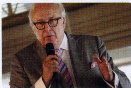
Puttend uit een rijk geheugen.