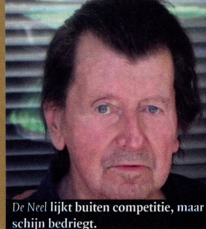
De Neel lijkt buiten competitie, maar schijn bedriegt.